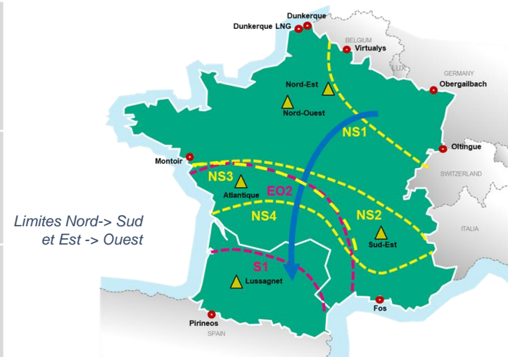
Limites Nord-> Sud et Est-> Ouest