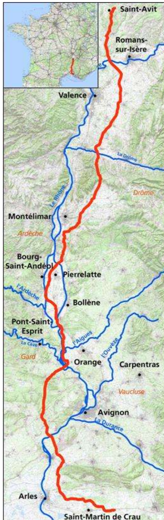
Carte du projet ERIDAN