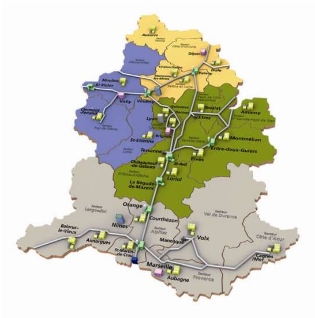
Carte de la région Rhône Méditerranée