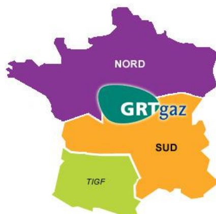
Les zones d'équilibrage en 2009

GRTgaz gère la majeure partie du réseau de gaz H et le réseau de gaz B dans le nord du pays.