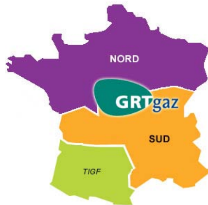
Les zones d'équilibrage en 2009

GRTgaz gère la majeure partie du réseau de gaz H et le réseau de gaz B dans le nord du pays.