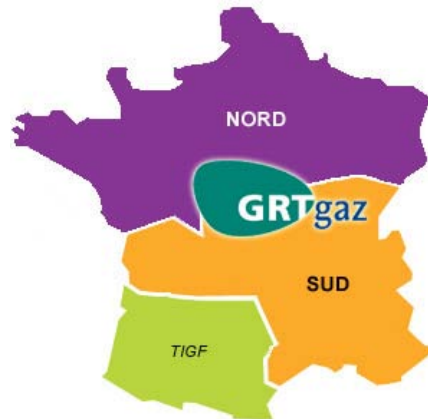
Les zones d'équilibrage en 2009

GRTgaz gère la majeure partie du réseau de gaz H et le réseau de gaz B dans le nord du pays.